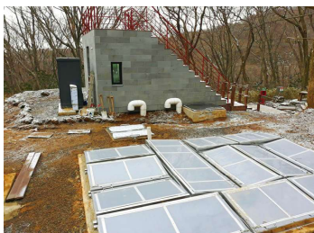
韓国 濟州島(登山用トイレ)