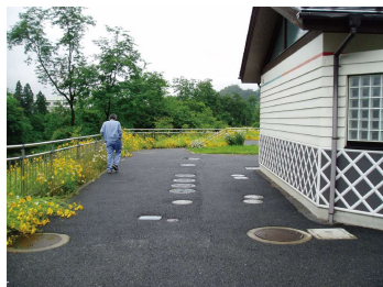
滋賀県 草津市(湖岸緑地公園)