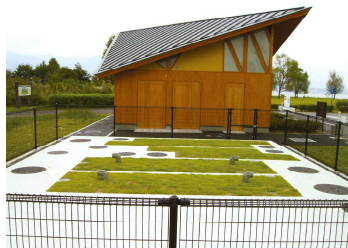
埼玉県 道のオアシス神泉(休憩施設)